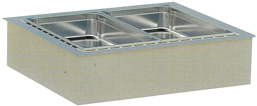
Die neue Trocken-Bain Marie setzt auf Warmhaltung mittels Umluft – ganz ohne Wasser.

Mit den warmen Showcases, einer Wärmeplatte oder Bain Maries lassen