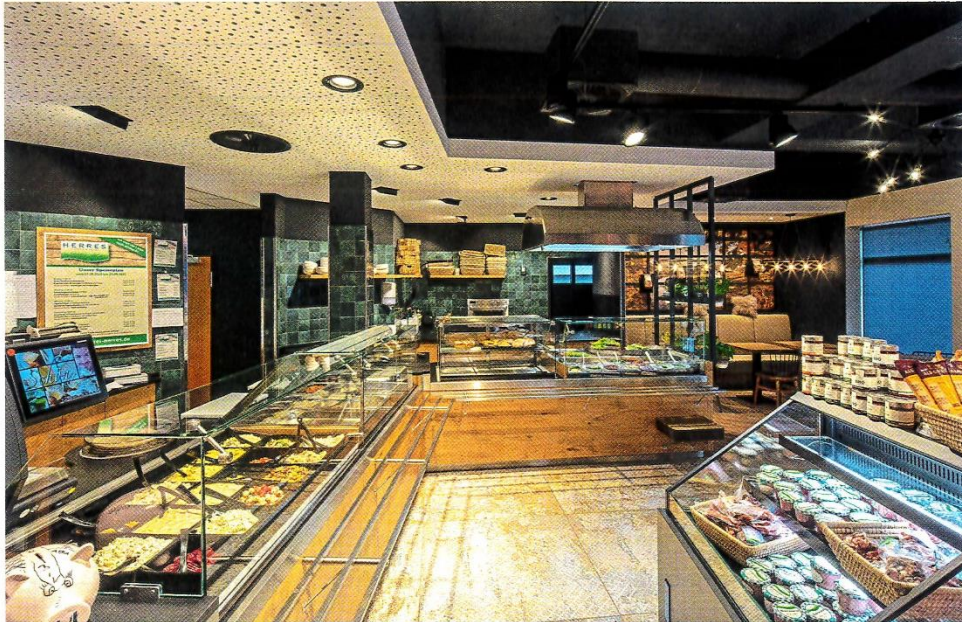
Schrutka-Peukert gestaltete die Einrichtung der Fleischerei Herres im Landkreis Trier-Saarburg.