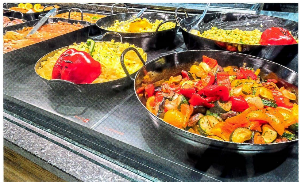
Warmhaltesysteme sorgen für eine ansprechende und verkaufsfördernde Präsentation warmer Speisen.

Die Platten können einzeln und gradgenau bis 150 Grad Celsius eingestellt und auch für die Präsentation kalter Speisen genutzt werden. Die kurze Aufwärmzeit und die zuschaltbare Oberhitze durch Infrarot-Wärmestrahler bringen das Warmhaltesystem schnell in Betriebsbereitschaft.