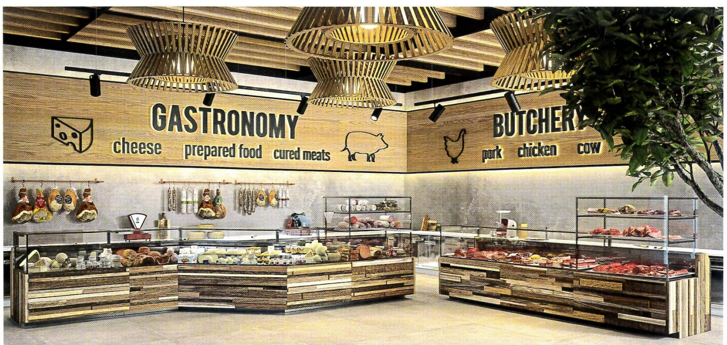
Bei der Gestaltung eines Ladenkonzepts sind Ergonomie und Warenpräsentation wichtig.

Die klassische Bain Maries mit Wasserbad gibt es in zwei Ausführungen: die First Class-Ausführung erleichtert mittels vollautomatischer Wasserbadregulierung mit Sensorelektronik den Arbeitsalltag des Nutzers, in der Business Class-Ausführung erfolgt die Wasserbefüllung manuell. Die doppelwandige Konstruktion (Innen- und Außenbehälter in Edelstahl) garantiert eine effiziente Isolierung und die stufenlose Regelung von 30 bis 90 Grad Celsius sorgt für die gewünschte Temperatur.