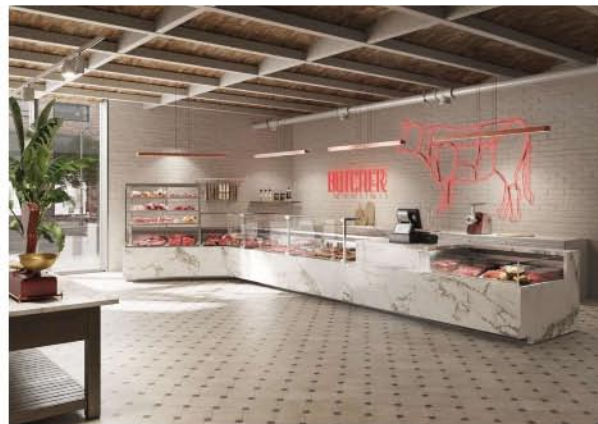
Negozio di vicinato anniati Epta: Eurocryor S1111 Bistrot

Non sempre la visibilità del prodotto garantisce anche praticità e comodità per l'operatore. Per questo Epta ha studiato Visualis che coniuga la visibilità con un agevole caricamento e servizio al cliente: banchina ergonomica inclinata e senza sporgenze, per favorire un approccio ottimale alla vasca; piano di lavoro scorrevole e accessori dedicati per un uso razionale degli spazi.