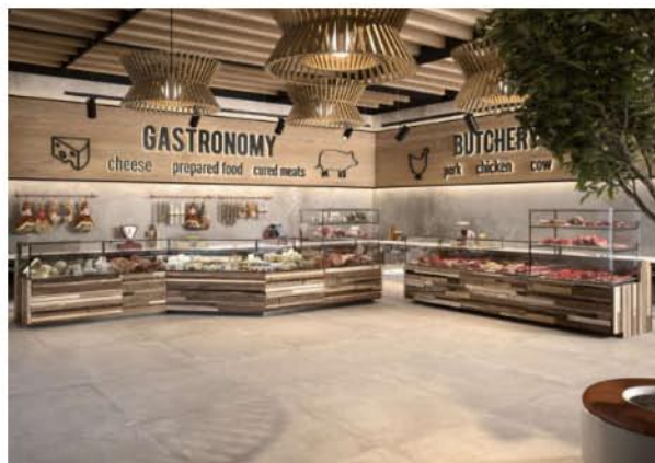
Negozio di vicinato: arredi Epta: Eurocryor Still Visualis

La formula del negozio di vicinato ha trovato nuova energia durante la fase pandemica perché è riuscito a rispondere nella maniera più efficace ai bisogni delle persone. A sua volta, lo store di quartiere è cresciuto, ha sviluppato nuovi servizi e organizzato l'offerta, pur nel poco spazio a disposizione, per incontrare nuove necessità mai manifestate prima. A cominciare dall'organizzazione delle consegne a domicilio, o a una revisione del layout per accogliere assortimenti più focalizzati in base alle location.