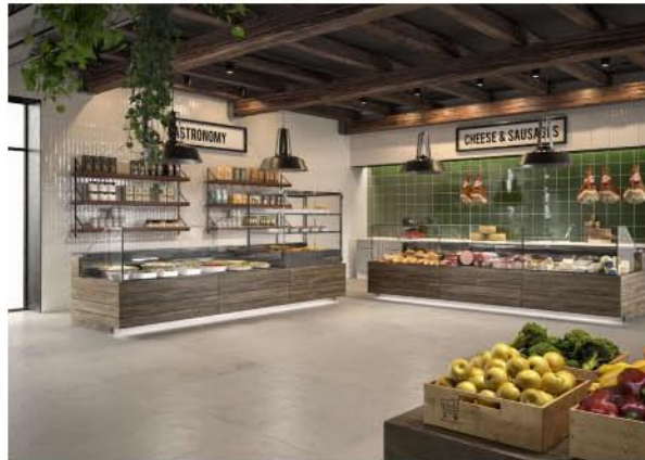
Negozio di vicinato anniati Epta: Eurocryor S1111 Panorama

La gamma Stili integra le principali tecnologie Epta per la conservazione degli alimenti. Tra queste, Dynamic System per la carne permette di mantenere l'umidità sopra il 90% senza impiegare umidificatori e senza dover spostare i tagli nelle celle durante la notte, per una maggior efficienza operativa. Per ambienti con variazioni di temperatura frequenti, Adaptive System regola i parametri del banco in modo continuo , a garanzia delle migliori prestazioni e costanza di conservazione del prodotto, con un conseguente risparmio energetico .